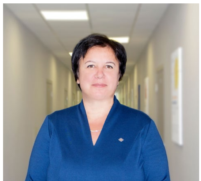
Генеральна директорка ЦГЗ Людмила Черненко

“Війна створила нові виклики для медичної галузі України: як для лікарів, так і для пацієнтів, і реагувати на них потрібно миттєво. Кожен працівник Центру розуміє, що від його роботи залежить життя сотень тисяч співвітчизників. В умовах постійних атак ми шукаємо, як допомагати медикам і пацієнтам, і разом долаємо виклики”, — каже генеральна директорка Центру громадського здоров'я Людмила Черненко.