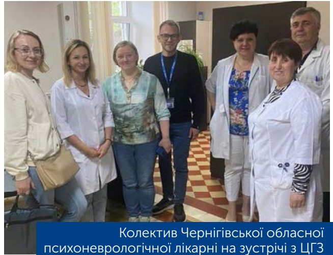
Колектив Чернігівської обласної психоневрологічної лікарні на зустрічі з ЦГЗ

У ході візиту фахівці ЦГЗ обговорили з медичними працівниками поточну ситуацію з впровадженням ЗПТ та потреби, що є у закладів, питання фарменеджменту, шляхи покращення якості надання медичної допомоги та інструменти залучення нових пацієнтів, поспілкувались з пацієнтами та соціальними працівниками.