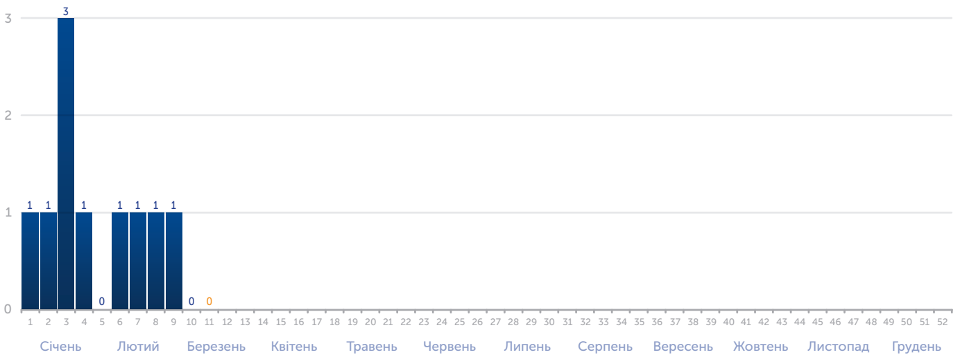
Рис. 7. Кількість летальних випадків внаслідок кору з початку 2019 р.