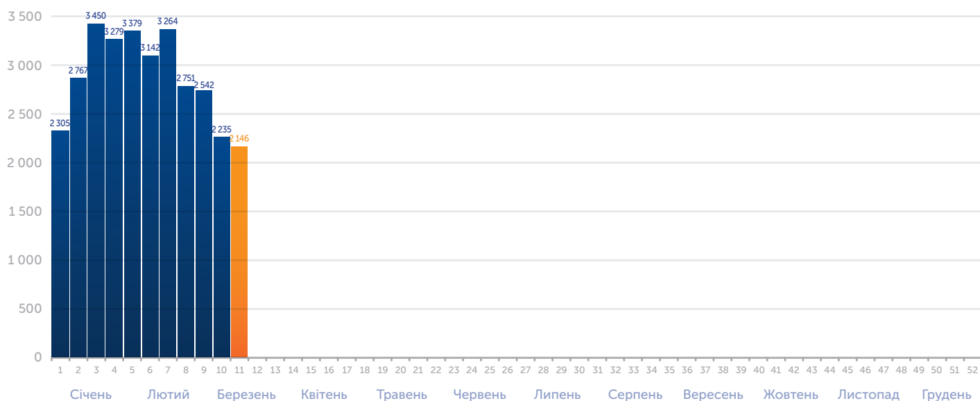
Кількість захворілих на кір за звітний тиждень**