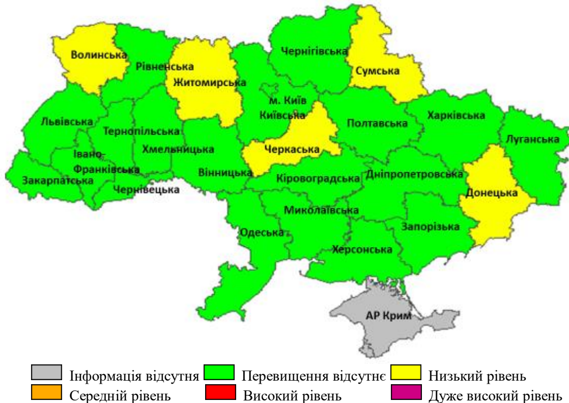
Рис. 3. Перевищення епідемічних порогів захворюваності на грип та ГРВІ серед регіонів України, 45 тиждень 2020 року

У більшості регіонів України активність грипу та ГРВІ була на неепідемічних рівнях. У Волинській, Донецькій, Житомирській, Сумській та Черкаській областях зареєстровано низький рівень перевищення епідемічного порога — від 2,8% до 19,1%.