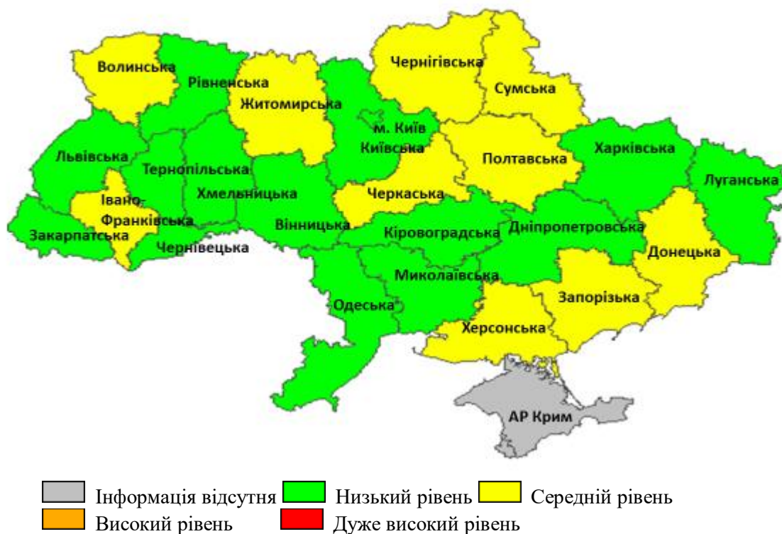
Рис. 3. Перевищення епідемічних порогів захворюваності на грип та ГРВІ серед регіонів України, 46 тиждень 2020 року

У більшості регіонів України інтенсивний показник захворюваності на ГРВІ продовжує бути нижче або на рівні епідемічного порога. Інтенсивність епідемічного процесу в Івано-Франківській, Волинській, Донецькій, Запорізькій, Полтавській, Сумській, Черкаській, Чернігівській, Херсонській та Житомирській областях відповідає середньому рівню інтенсивності — інтенсивний показник захворюваності на ГРВІ в зазначених областях перевищує епідемічний поріг від 0,2% до 18,2% (рис. 3).