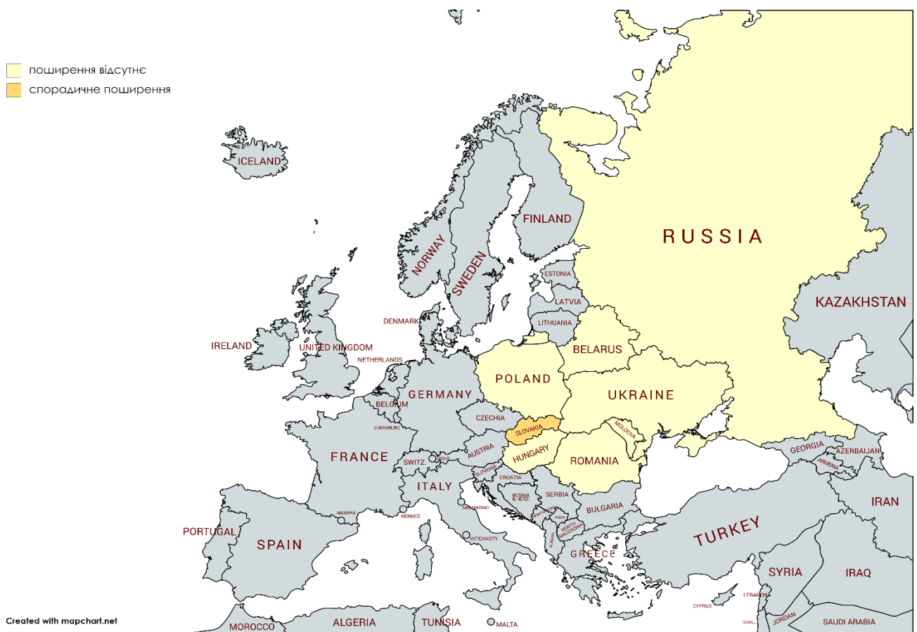
Рис. 1. Адаптовано на основі карти географічного поширення грипу в країнах європейського регіону ( http://flunewseurope.org ) за 45 тиждень 2020 року