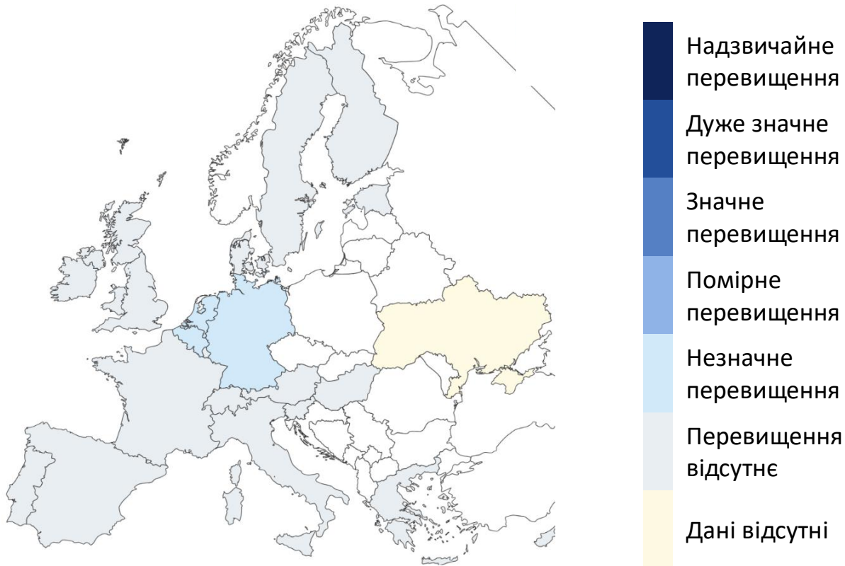
Рис. 1. Рівень надлишкової смертності від грипу на основі мапи зі щотижневим Z-показником 1 для всього населення у країнах-партнерах EuroMOMO та субнаціональних регіонах, що надають дані, 26 тиждень 2023 року