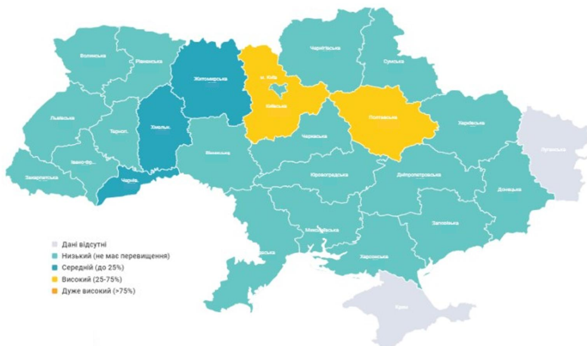
Рис. 2. Розподіл регіонів України за показниками захворюваності на ГРВІ, 40 тиждень 2023 року

Найвищі інтенсивні показники захворюваності на ГРВІ, зокрема грип та COVID-19, — у Полтавській (629,9), Київській (615), Житомирській (540,1), Чернівецькій (505,2), Хмельницькій (479,5) областях. Найнижчі інтенсивні показники — у Херсонській (31,3), Харківській (82) та Запорізькій (109,8) — прифронтових областях, де обмежена можливість реєстрації пацієнтів із ГРВІ (рис. 2).