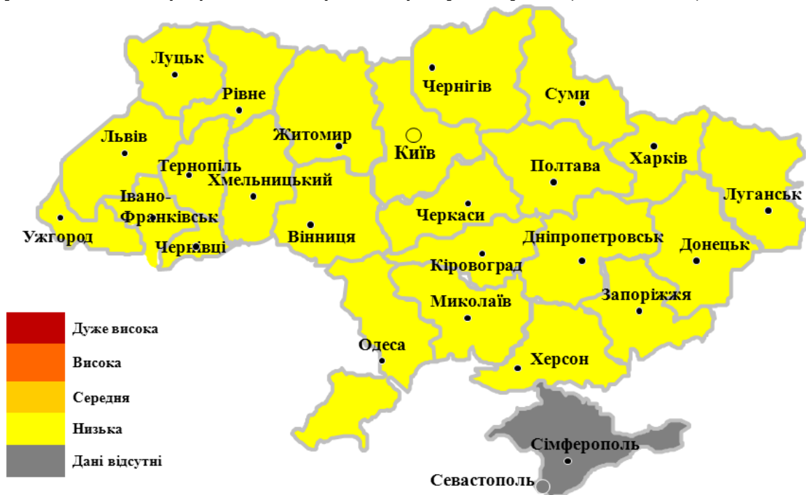
Мал.2. Інтенсивність активності грипу та ГРВІ в Україні, 44/2018

В Україні спостерігається низька інтенсивність епідемічної активності грипу та ГРВІ, географічне поширення грипу відсутнє (малюнок 2).